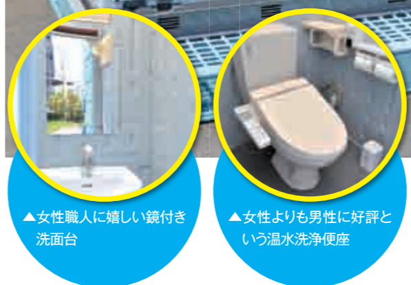
▲女性職人に嬉しい鏡付き洗面台