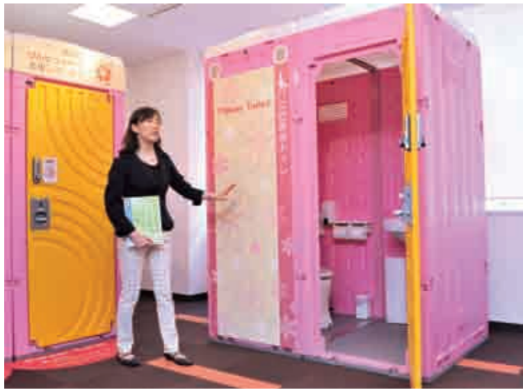
▲女性用トイレのフラワートイレWLXシリーズ。フラワートイレは「けんせつ小町が働きやすい現場環境整備マニュアル」に準拠している

「仮設トイレを安心して利用できることで、建設現場の女性にとって一番重要なこと。例えば「鍵が壊れていないかな？」とか、「外で男性が待っているのかな」など考える必要がなく、着いて利用できます。そこで暗証番号付きの二重ロックや擬音装置の取り付けが考えられました。また女性は、個室の中で用を足すだけでなく、ちょっとした身だしなみを整えます。すると鏡や洗面台が必要になっ