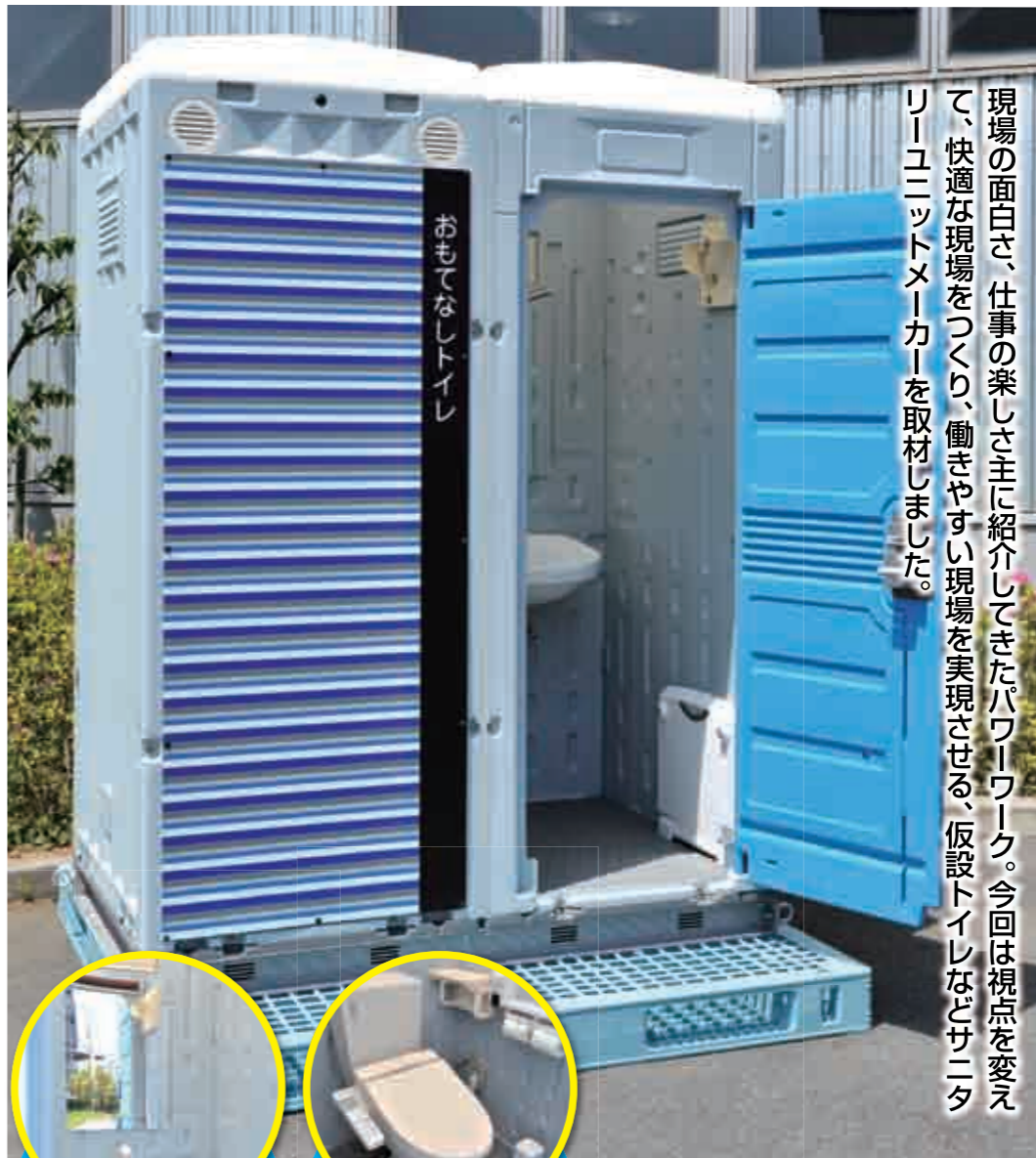
▲従来の倍のスペースで着替えにも便利な仮設トイレ。元々は女性用トイレとして開発されたが、機能はそのままに男女ともに使用しやすいカラーリングを設定

現場の面白さ、仕事の楽しさ主に紹介してきたパワーワーク。今回は視点を変えて、快適な現場をつくり、働きやすい現場を実現させる、仮設トイレなどサニタリーユニットメーカーを取材しました。